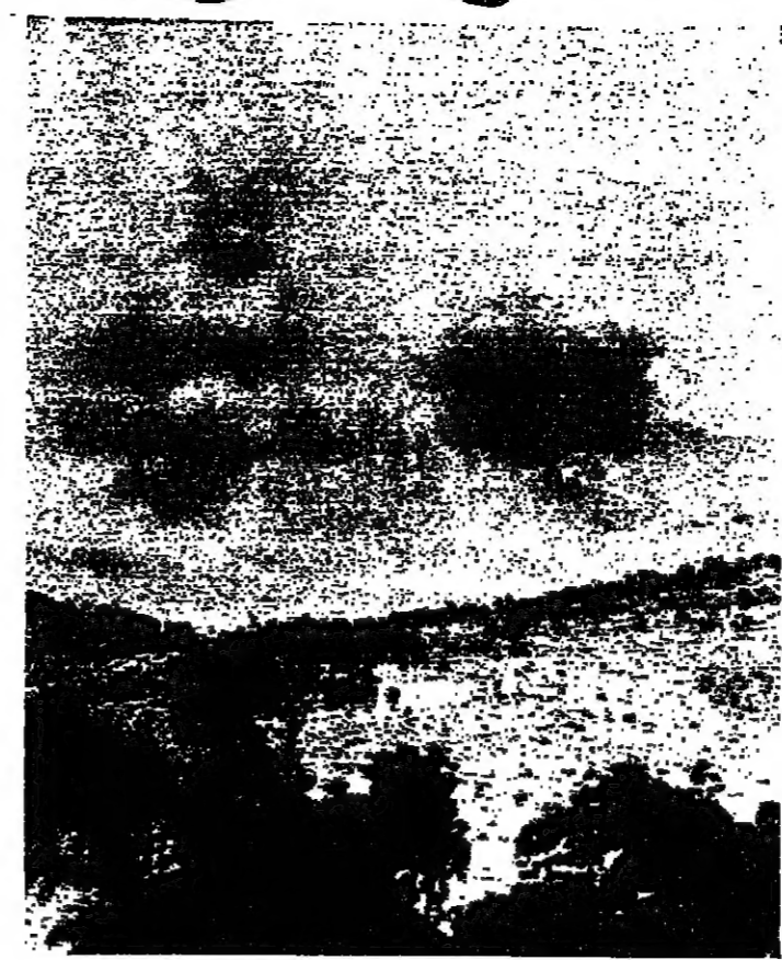
الدخان بسبب من جراء القصف الإسرائيلي لضواحي كفرشوبا